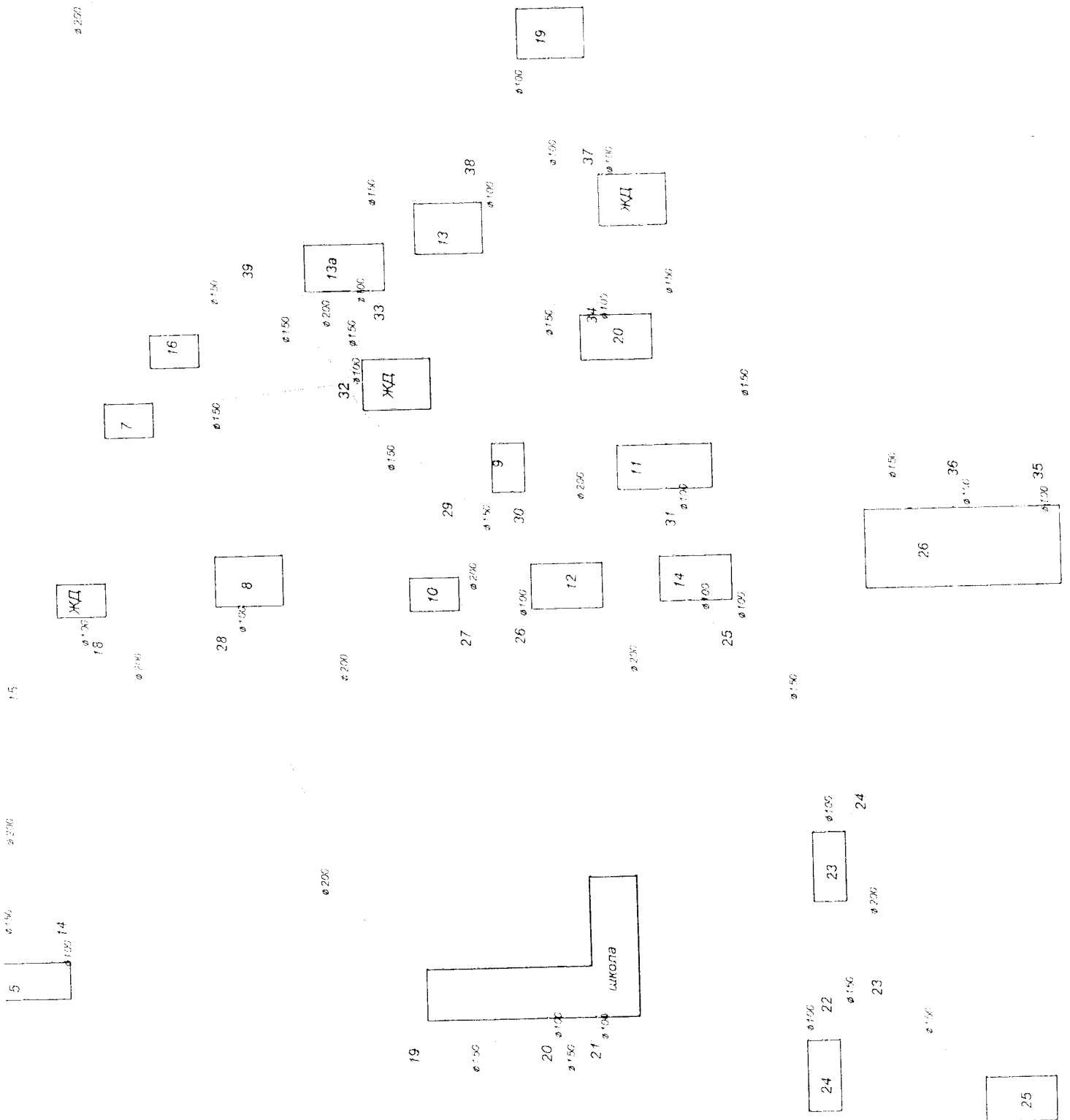
Схема ВОДОСНАБЖЕНИЯ И ВОДООТВЕДЕНИЯ в д. Новые Ельцы